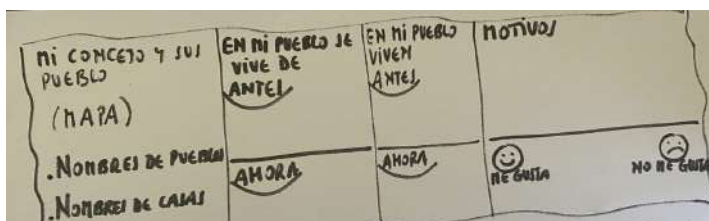
Imagen: ejemplo esquema mural , que incluye espacios para todos los items del cuestionario.

Cuestionario para familias, Anexo 3/Papel mural/Rotuladores y bolígrafos